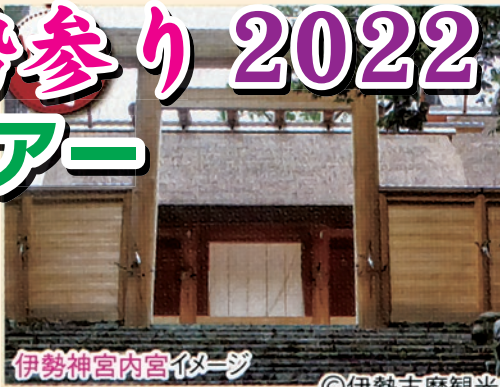
伊勢神宮内宮イメージ