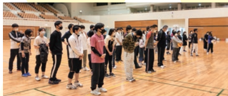
第21回大会参加のみなさん

★コロナ渦の中、やむを得ない事情により中止となる場合があります。その場合はご容赦ください。