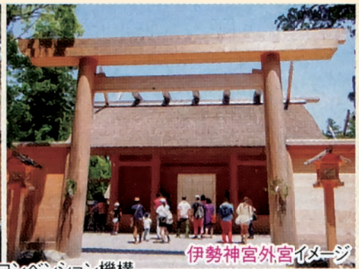
伊勢神宮外宮イメージ