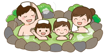
《安城コロナワールド》

★新型コロナウイルス感染拡大防止対策を講じておりますが、内容につきましてはホームページ等でご確認ください。