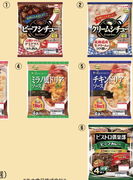
◀丸大食品株式会社▶