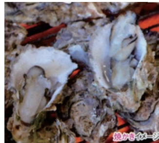
焼きかきイメージ