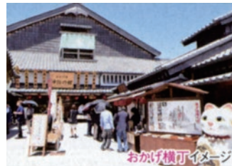
おかげ横丁イメージ