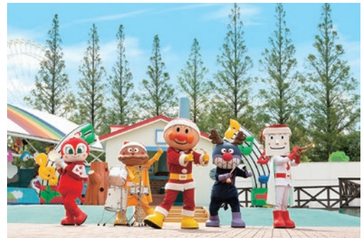
《名古屋アンパンマンミュージアム事務局》