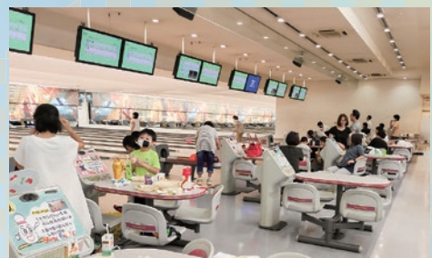
第69回ボウリング大会参加のみなさん

★新型コロナウイルス感染拡大防止対策につきまして、必ずマスクの着用等をお願いいたします。開催に際しましては、消毒液を準備する等対策を行います。愛知県下の今後の推移によっては中止となる可能性もございますのでご了承ください。