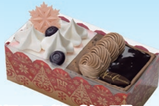
② クリスマスベリー&ショョロ (縦約8.2cm×横約16.5cm×高さ約5cm) 2,500円(一般3,300円)