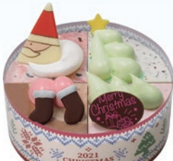
④ クリスマスパレット4(4号) 2,600円(一般3,400円)