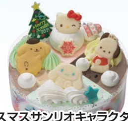
⑥ クリスマスサンリオキャラクターズ スノーパーレット(4号) 2,900円(一般3,700円)

© Nintendo・Creatures・GAME FREAK・TV Tokyo・ShoPro・JR Kikaku © Pokémon