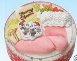
③ ミッキー&ミニーマウスクリスマスブーツ(5号) 2,800円(一般3,600円)