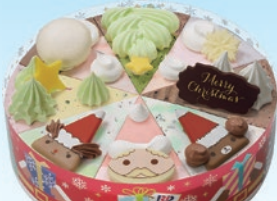
① クリスマスパレット8(6号) 3,600円(一般4,600円)

共済会へFAXで申込後、引換券を発行いたします。ご希望の店舗へ、引換券をお持ちの上、商品とお引換ください。