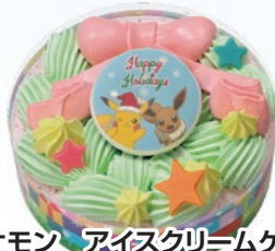
⑤ ポケモン アイスクリームケーキ クリスマスシリーズ(6号) 2,800円(一般3,600円)