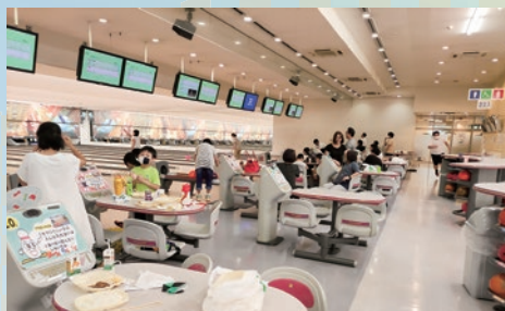
第69回ボウリング大会参加のみなさん