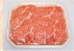
ロース肉 イメージ