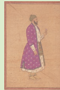
《貴族の肖像》 —ムガルまたはコルコンダ派— 17世紀前期