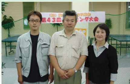
前回個人戦入賞のみなさん