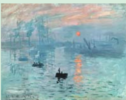
クロード・モネ「印象 日の出」1873年 マルモタン美術館 (パリ)

「印象 日の出」は、『印象派』の名前の由来となった作品として有名で、フランスでも別格の存在として美術館外に貸し出されることは非常に稀です。今回の展覧会は、モネ生涯の傑作であり近代美術の分岐点をなす「印象 日の出」を中心に、ルノワール、セザンヌ、ピサロなど、他の作家の作品をあわせて展示し、『印象派』の本質と広がり、それぞれの作家の個性の輝きを紹介します。