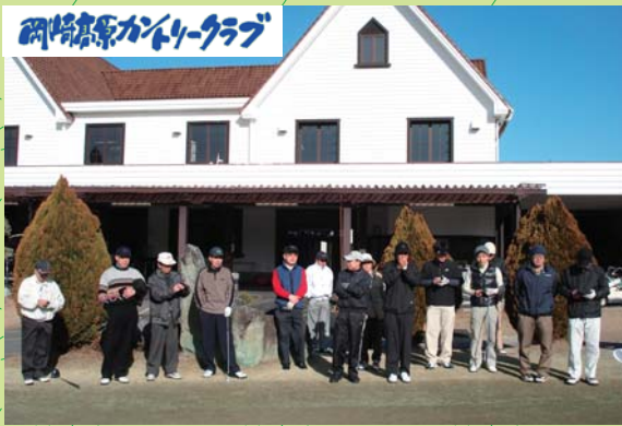
第13回岡崎高原C.C.ゴルフコンペ参加のみなさん

皆さん、お気軽にご参加ください!もちろん初心者の方も大歓迎!多数の方の参加をお待ちしております。