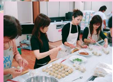
昨年度の「秋の栗菓子作り教室」参加のみなさん