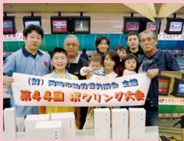
※写真は第44回大会エールボウルにて

春になり新しく職場に入られた方も沢山おみえだと思えます。職場の親睦を深めましょう! もちろん、ご家族でのご参加もOKです!各賞商品も多数ご用意いたします。