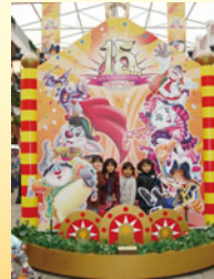
※写真は前回のバス旅行時のものです。