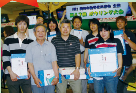
入賞者のみなさま

6月26日(金)エールボウル(福岡町)にて、第47回ボウリング大会(団体戦)を開催しました。ストライク賞のジュースはみるみる減っていき、みなさん絶好調でした!