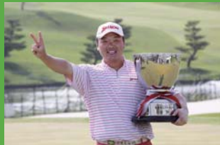
2009年優勝者 小田孔明選手

2010年度ジャパングolfツアー(男子)開幕戦として開催されます。今シーズンを占う意味でも大変注目を集めるこの大会。手に汗握るトッププロのハイレベルなプレーをご堪能下さい!