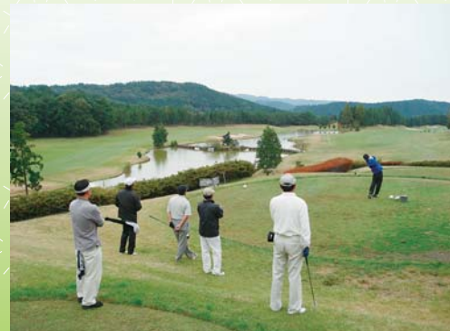
※先回の加茂ゴルフ倶楽部コンペの様子