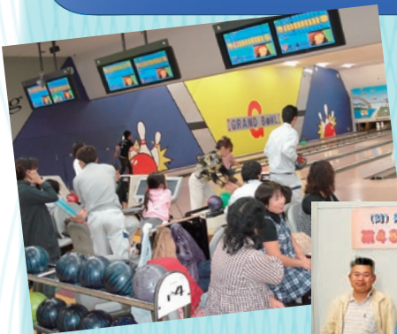
※写真は第48回大会グランドボウルにて