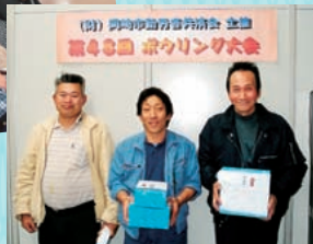
先回の入賞者のみなさま▶

新しい仲間を迎え、みなさんで楽しめるようにボウリング大会(団体戦)を開催！職場の仲間や、ご家族でのご参加をお待ちしております！各賞商品も多数ご用意いたします。