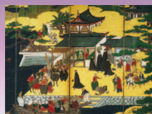
重要文化財 南蛮屏風(部分) サントリー美術館蔵 <展示期間 10月19日~11月7日>

★戦国の世を太平へと導いた3人の天下人、織田信長・豊臣秀吉・徳川家康。三英傑が活躍し、日本の社会が変わるターニングポイントとなった安土桃山時代を、幻の城である聚楽第を描いた貴重な屏風や城郭御殿、漆器や茶陶の変貌を通して紹介します。 尾張名古屋400年の礎となった激動の時代のエネルギーと桃山文化の美を、かつてない規模で堪能できる展覧会です。