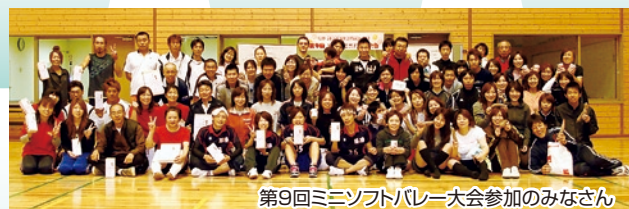
第9回ソフトミニバレー大会参加のみなさん