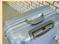
※若干スキマが開いています