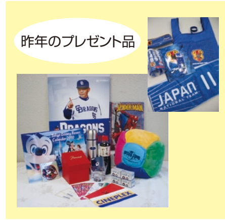
昨年のプレゼント品