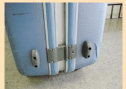
※若干割れています