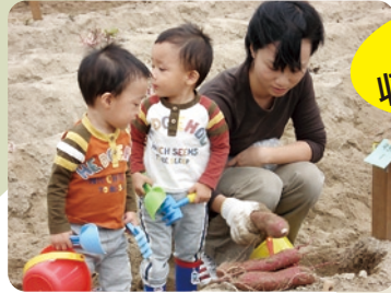
昨年の 収穫の様子