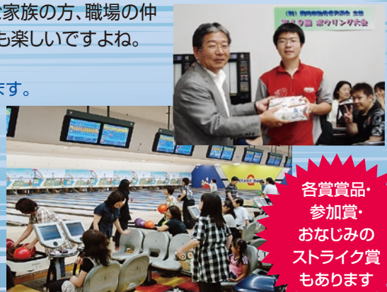
第49回ボウリング大会参加のみなさん