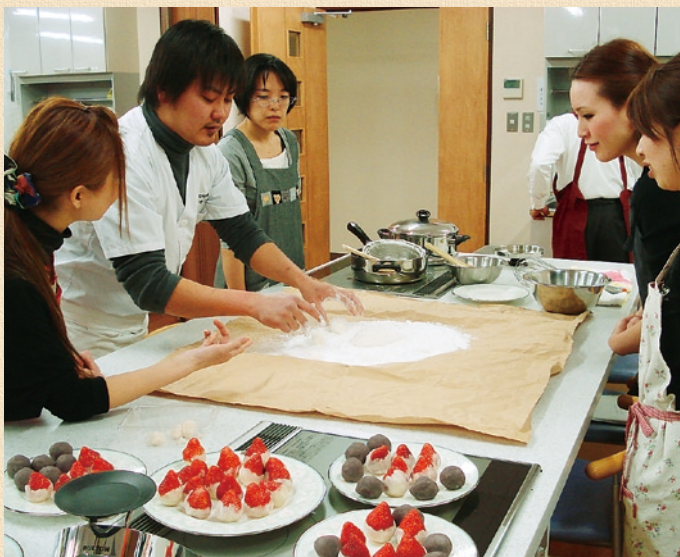
昨年の春の和菓子作り教室の様子

今回は、バレンタインの時期に合わせて、チョコを使った「チョコ大福」と定番の「さくらもち」を作る予定です。気になるあの人、大切なお友達へ、チョコ大福を贈ってはいかがでしょうか。