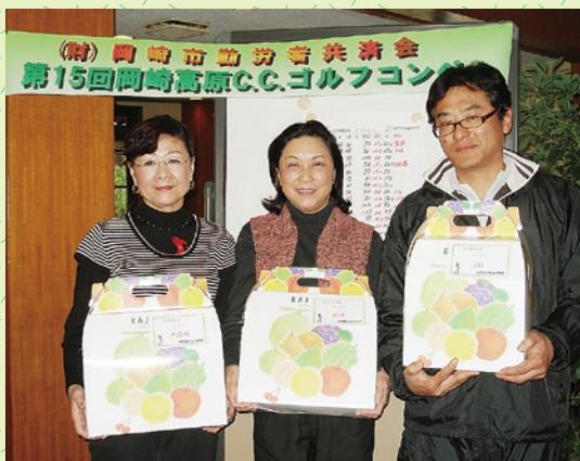
前回の入賞者のみなさま