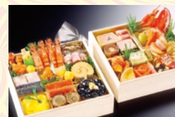
和洋二段重(4~5名様用) 18,900円(一般:21,000円)