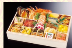
和洋中一段重(3~4名様用) 15,800円(一般:17,850円)