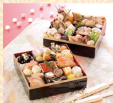
和風ミニおせち・二段(2~3名様用) 12,600円(一般:15,000円)