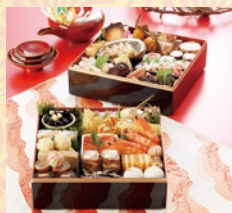
和風・二段(4~5名様用) 18,900円(一般:23,000円)