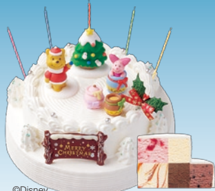
©Disney Based on the "Winnie the Pooh" works by A.A.Milne and E.H. Shepard.

※6号(直径約19cm×高さ約6cm)・5号(直径約16cm×高さ約5cm)・プッシュド ノエル(ヨコ約9cm×タテ約17cm×高さ約7cm)