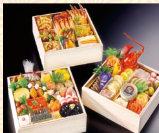
和洋中三段重 (5~6名様用) 34,900円 (一般:38,850円)