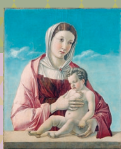
ジョヴァンニ・ベリーニ(聖母子) 1470年頃 コッレル美術館

★水の都、ヴェネツィア。「アドリア海の女王」と称されたこの都市は、海上貿易がもたらした富により華麗な文化が花開きました。ヴェネツィア派の絵画やヴェネツィアン・グラス、大航海時代の航海道具などを通じ、その歴史をたどります。