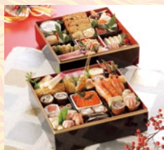
和洋・二段(4~5名様用) 18,900円(一般:23,000円)