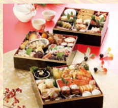
和洋・三段(4~5名様用) 27,000円(一般:33,000円)