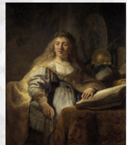
レンブラント・ファン・レイン 《書斎のミネルヴァ》 1635年 1372x1160mm 個人蔵

★レンブラント・ファン・レイン(1606-1669)は、17世紀を代表するオランダの画家であり、古くより「光と影の魔術師」「明暗の巨匠」と呼ばれ、光の探求や陰影表現、明暗法を終生追及した画家でした。本展は、版画と絵画におけるレンブラントの「光と影」の真の意味を再検討しようとするもので、オランダ・アムステルダム市のレンブラントハイスの協力のもと、アムステルダム国立美術館、大英博物館、ルーヴル美術館などが所蔵する世界中の重要なレンブラント作品で構成されます。明暗表現を考察する上で重要な役割を果たした版画と絵画を取り上げ、その初期から晩年にいたる作品まで、レンブラントがどのように明暗表現に取組んだかを辿ります。レンブラントによる「光の探求」、そしてみるものを惹きつけてやまない「闇の誘惑」、レンブラントが追及した光と影の芸術の世界にどうぞご期待ください。