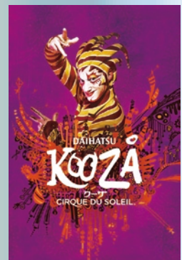
Costume: Marie-Chantale Vaillancourt

舞台は、自分の居場所を探し求める少年、イノセントが、トリックスターに誘導され、王様とその家来のクラウン、詐欺師など様々な人物に出会うことによって繰り広げられます。観る人全てに驚きと感動を与え希望を抱かせてくれる「クーザ」は、これまでのシルクの集大成、そしてこれからのシルクの歴史を築く礎となる作品です。