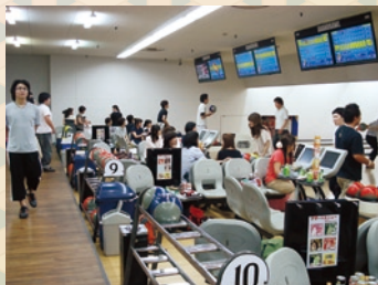
第53回ボウリング大会参加のみなさん

今回は秋の個人戦です。己の腕を信じ、一球入魂!ご家族でも、お一人様でもみなさんお気軽にご参加ください!