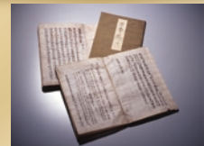
国宝「古事記」 南北朝時代(大須観音宝生院蔵)

●会期 / 12月1日(土)~1月14日(月・祝) ※9:30~17:00(入場は16:30まで) ●休館日 / 毎週月曜日(12/24、1/14は除く)、12/25(火)、12/29(木)~1/3(火) ●入場料 / 一般 500円(一般当日:1,000円) 高大生 300円(一般当日:600円) 小中生 100円(一般当日:400円) ★節分や人形供養などで親しまれている大須観音は、国宝「古事記」を始めとする古典籍の宝庫です。古事記が完成して1300年の記念すべき年に、大須観音が伝える貴重な文化財を、大須の街のにぎわいとともにご紹介します。 ≪名古屋市博物館≫