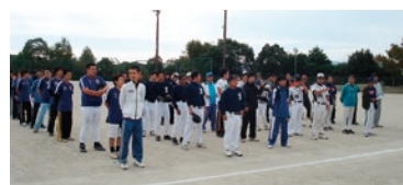
前回参加の皆さん