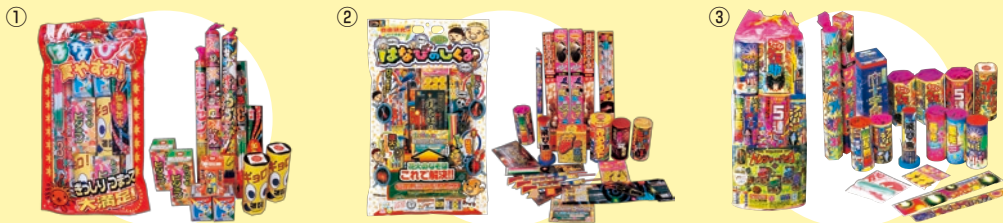
協賛 《株稲垣屋》 《株太田煙火製造所》 (敬称略、順不同)