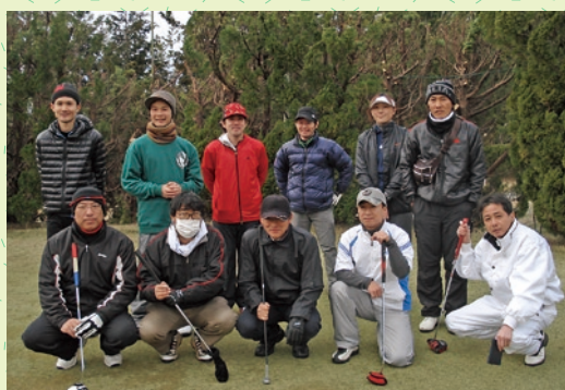
昨年の参加者の皆様です