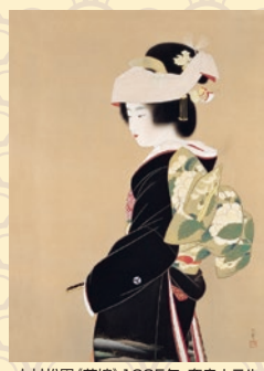
上村松園(花嫁)1935年、奈良ホテル