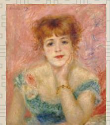
ピエール＝オーギュストルノワール 《ジャンヌ・サマリーの肖像》1877年 ©The State Pushkin Museum of Fine Arts, Moscow