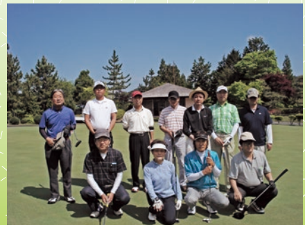
第54回大会参加のみなさん

※個人参加の方の組合せは、事務局にて決めさせていただきます。 ※お一人様のご参加は他の参加者の組に入ります。 ※申込多数の場合は抽選となります。 ※賞品代・パーティ代以外は個人負担とさせていただきます。ラウンド終了後、表彰式を行います。その場で軽食をご用意します。