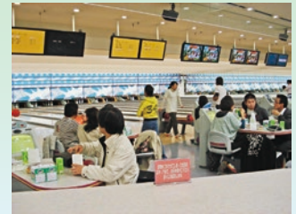
第54回ボウリング大会参加のみなさん