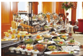
※写真はイメージです ジーニス ブッフェ