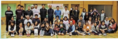
第12回大会参加のみなさん

やわらかいゴムのボールですので、安全にどなたでもお気軽に楽しめます。職場の仲間と一緒に、健康維持増進にまい進しましょう!