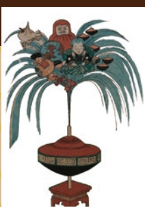
二代歌川国貞 大坂下り 桜網駒司・桜網幸吉 (部分・安政4年[1857])