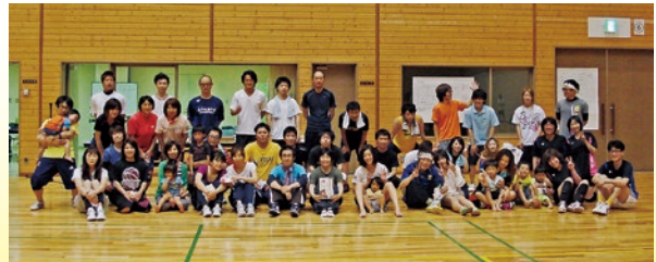
第13回大会参加のみなさん