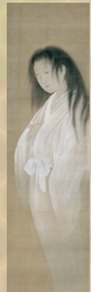
伝丹山成峯「幽霊図」 江戸時代中期 福岡市博物館蔵