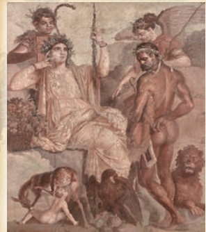
《赤ん坊のテレフォスを発見するヘラクレス》(部分) 後1世紀後半 ナポリ国立考古学博物館蔵