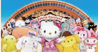
©08.16 SANRIO/SEGA TOYS S・S/TX・JLPC ©16 SANRIO APPROVAL No.P0806175

大人(18歳以上)【通常料金 平日¥3,300・休日¥3,800】 → 大人・小人共通(3歳以上) 小人(3~17歳)【通常料金 平日¥2,500・休日¥2,700】 1,800円