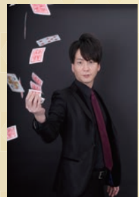
◀ホテルトヨタキャッスル▶

★観客の目の前で行うクローズアップマジックから、大掛かりなイリュージョンまで、幅広いジャンルのレパートリーを持つ。中でも最も得意としているのは、人の脳に潜り込み、本人しか知りえない情報をダイレクトに読み取るという、全く新しいスタイルのマジックで、自ら「ブレインダイブ」と命名し、各方面で注目を集めている。テレビ等メディア多数出演!