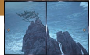
「唐招提寺御影堂障壁画 濤声」(部分) 1975年

本展覧会は、唐招提寺御影堂の修理が行われるに際し、通常は非公開となっているこの障壁画全68面を一堂に会して展示し、その全貌を紹介する東海地方では初めての貴重な機会となります。