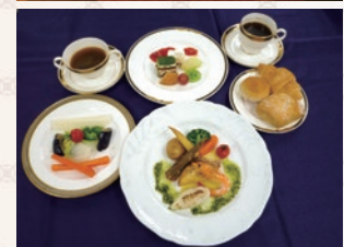
写真はイメージです。料理内容とお皿等変更がございます。