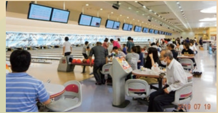
第67回ボウリング大会参加のみなさん