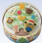
②メリクリ! “ミニオン”ツリー (5号) 2,700円(一般:3,500円) © Universal City Studios LLC. All Rights Reserved.