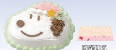
③“スヌービー”ハッピーサンタクロース 2,700円(一般:3,500円) © 2019 Peanuts Worldwide LLC. www.snoopy.co.jp