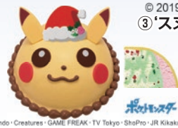
⑥ポケモンアイスクリーム クリスマス ピカチュウ 2,700円(一般:3,500円) © Nintendo・Creatures・GAME FREAK・TV Tokyo・ShoPro・JR Kikkaku © Pokémon