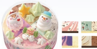
④クリスマスパレット4(4号) 2,500円(一般:3,300円)