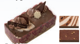
⑦クリスマスショコラ 2,300円(一般:3,200円)

※6号(直径約18.5cm×高さ約5cm)、5号(直径約16.0cm×高さ約5cm)、4号(直径約14cm×高さ約5cm) ※各アイスの詳しい内容はサーティワンのHPでご確認ください。 ※代金のお支払いは、共済会事務局窓口にて引換券発行時となります。