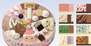
①クリスマスパレット8(6号) 3,500円(一般:4,500円)

共済会へFAXで申込後、引換券を発行いたします。ご希望の店舗へ、引換券をお持ちの上、商品とお引換ください。12月30日まで使える〆310円チケット、をもらえなくプレゼント！