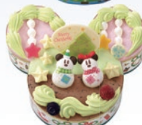
⑤<ミッキー&ミニ> トゥインクルリース © Disney 2,700円(一般:3,500円)