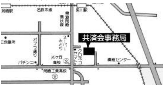
共済会事務局案内図