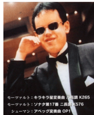
モーツァルト：キラキラ星変奏曲/久慈譲 K265 モーツァルト：ソナタ第17番 二長調 K576 シューマン：アベック変奏曲 OP1

小児癌により生後1ヶ月で失明。4歳半よりピアノを始める。1998年、フランスのロン＝ティボー国際コンクールで第2位入賞!