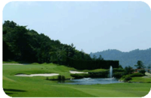
岡崎カントリー倶楽部 番ホール

日時：5月12日(水) OUT・IN 8:54スタート (下山村、約6,500Y、PAR72) 参加費：12,358円 (プレイ代、4バック、税込) 昼食・3ドリンク付き コンペ終了後、表彰式(軽食付き)を行います。