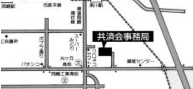
共済会事務局案内図