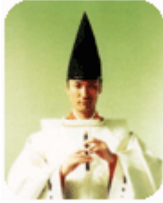
未就学児童は入場不可

日時：平成17年 1月16日(日) 17:00開演 会場：愛知県芸術劇場大ホール 席種：S席 料金：6,000円 (一般：7,500円) 古典雅楽の世界と、現代的な ステージで、東儀秀樹の魅力 をたっぷりとお贈りします。