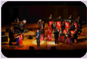
未就学児童は入場不可

日時：12月10日(金) 19:00開演 会場：愛知県芸術劇場 コンサートホール 席種：S席 料金：5,500円 (一般：7,000円) 「テイク・ファイブ」、「シング・シング・シ ング」、「ザ・チキン」、「クリスマスソング ・メドレー」他 結成15周年を記念してま すスケールアップし、待望の再来日!