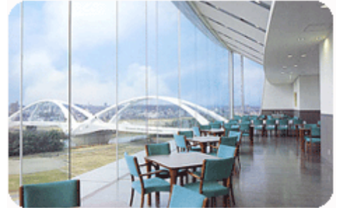
駐車料金は無料ですが、運転手の方の 飲酒は固くお断りします。

参考：グラスワイン1杯700円、ハーフボトル3,000円、フルボトル5,000円前後の予定です。