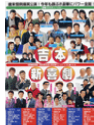
斡旋枚数：20枚 出演者変更の可能性あり

日時：12月12日(日) 11:00開演 会場：中日劇場 席種：A席 料金：4,500円 (一般：6,000円) 第1部：笑福亭仁幹、Wヤン グ、横木ジョージ&レミ、 ザ・ぼんち、桂きん枝、今い くよ・くるよ 第2部：新喜劇