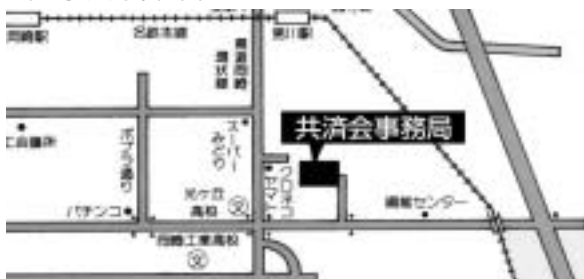
共済会事務局案内図

新規会員事業所募集中！お知り合いのお店や会社をご紹介ください。紹介特典もあります。