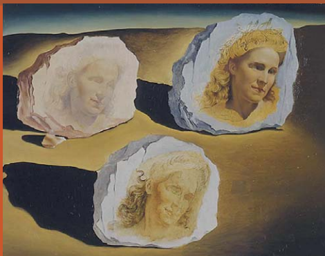
Worldwide rights © Salvador Dalí, Fundació Gala-Salvador Dalí, SPDA, Tokyo, 2007 《3つのガラ顔の出現》 油彩・ボード、1945年 ガラ＝サルバドール・ダリ財団