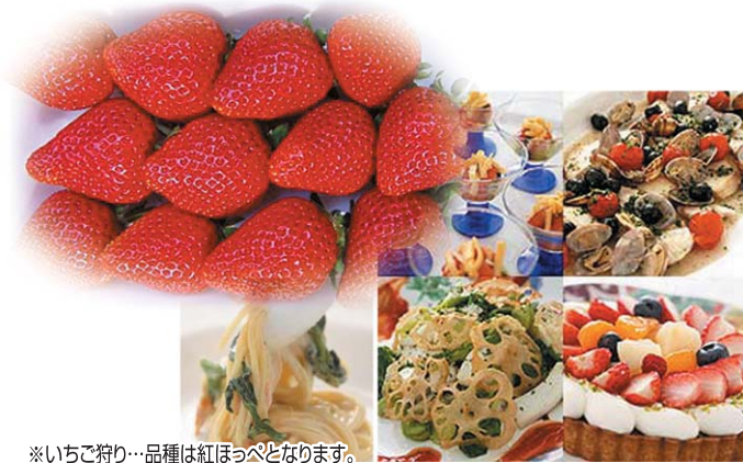
※いちご狩り…品種は紅ほっぺとなります。

美味しい、いちごが食べ放題! もちろん、お土産にもいちごをプレゼントします。 お昼は、ホテルアソシア静岡のシェフズ・ブッフェでお楽しみください。 さかなセンターでお買い物もどうぞ!!