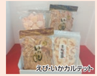
えび・いかカルテット

■内容量/いか焼(たまり)70g、いか焼(ピリ辛)105g、えび道楽60g、えび手焼き200g ■賞味期限/製造日より120日 ■斡旋価格/1,700円(一般:2,700円)