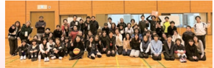
第25回大会参加の様子